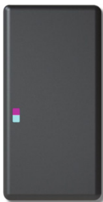
MEC-RFID med GSM

MEC-RFID med GSM er en online brikklæser der kan tilsluttes til eksisterende dørtelefonanlæg, og derved erstatte usikre og besværlige mekaniske nøgler, med sikre og billige nøglebrikker.